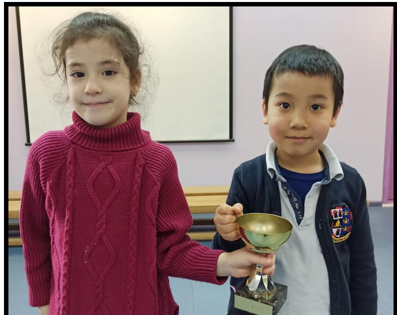
Выиграли Кубок – Класс Y1 DS с 95%