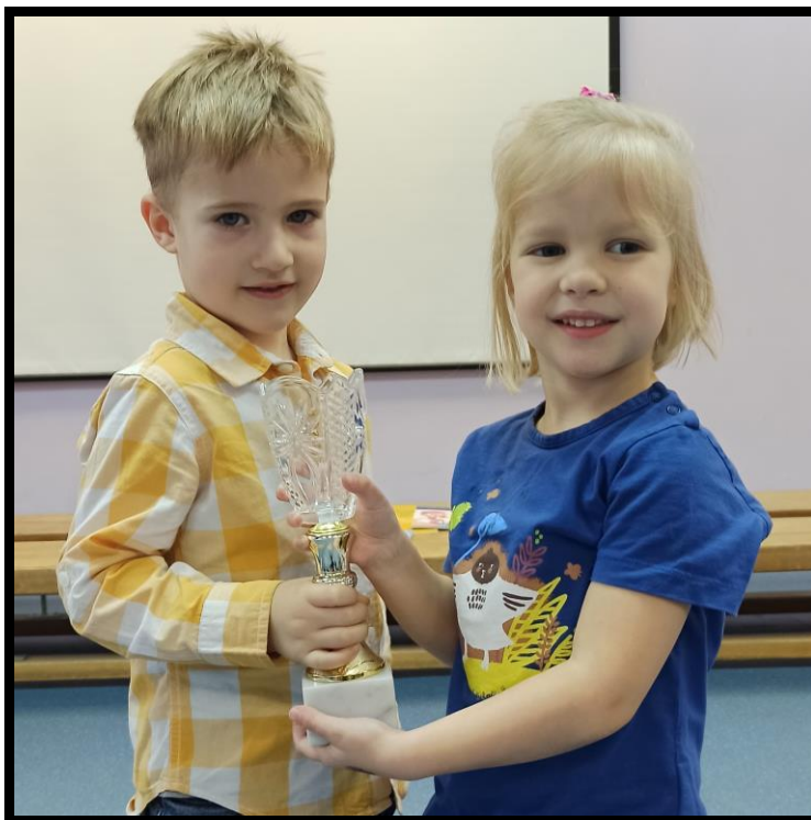
Дом - Победитель - Кандинский

Все молодцы, кто неплохо поработал на этой неделе.