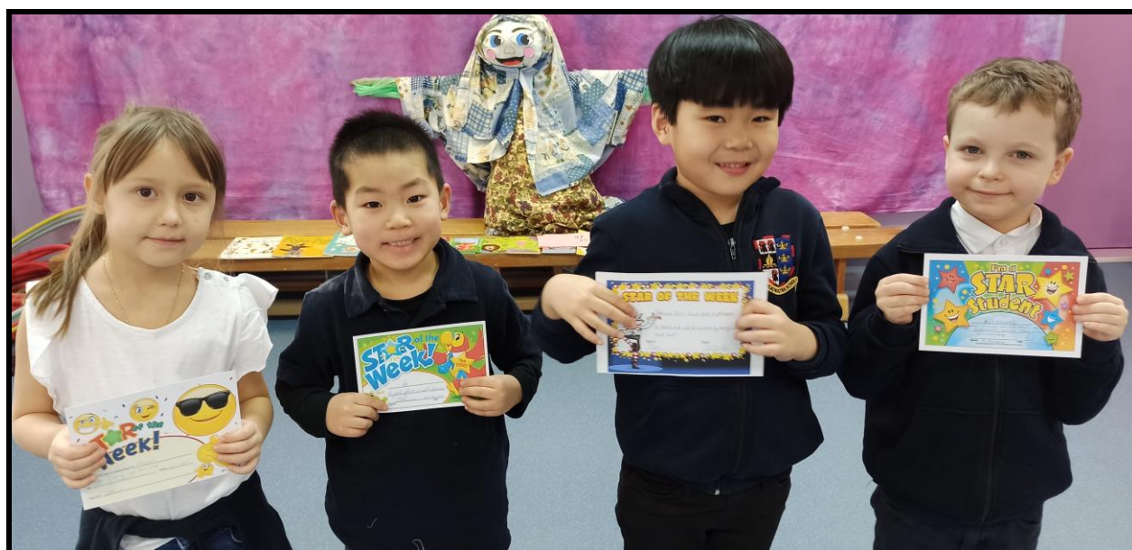
Y1 DS – Маруся,