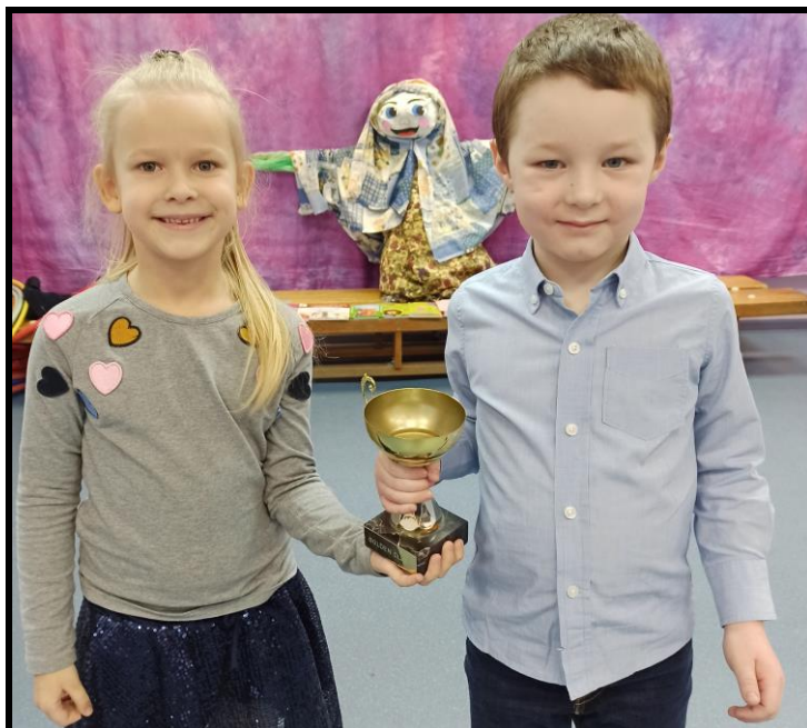
100% посещение Школы – Марк Кубок за лучшую посещаемость – класс Y1 DS с 91%