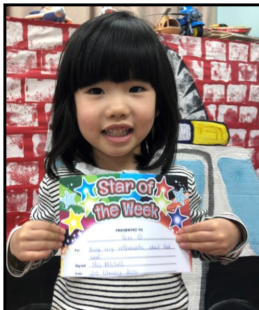
Nursery – Рюкси